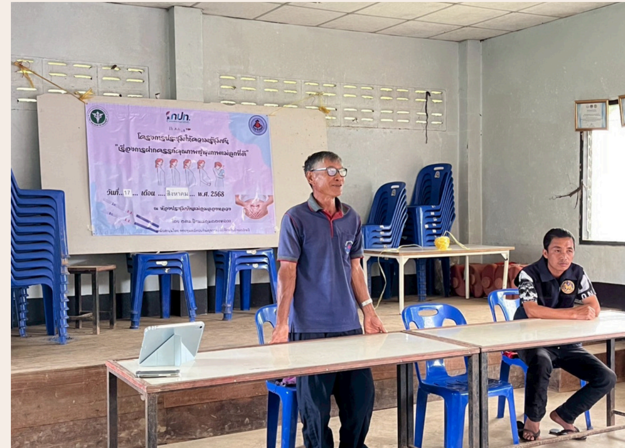
ประธานอสม.ช่วยแปล