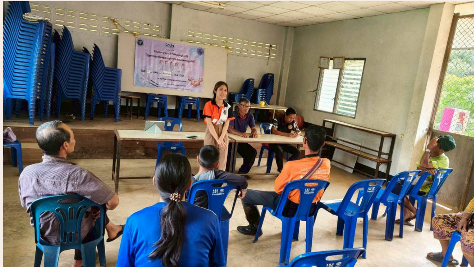
วิทยากรให้ความรู้เรื่องการดูแลเด็กทารก