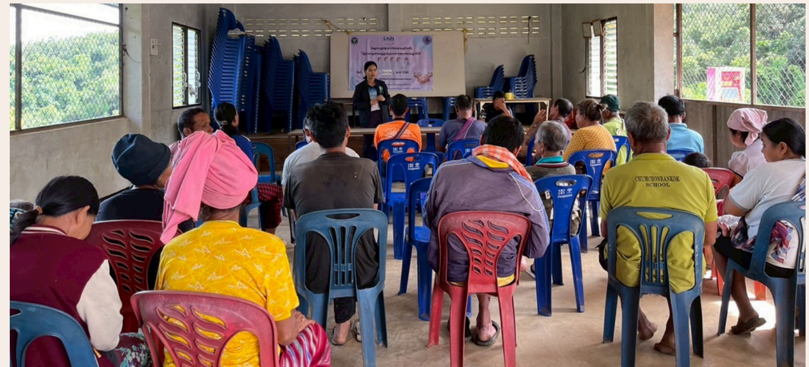
กิจกรรมสร้างความรู้ความเข้าใจ